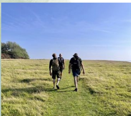
Vandretur på Æbelø

Den 5. september hvert år hylder og anerkender Aarhus Kommune den store indsats, som Danmarks udsendte har ydet for nationen. Flagdagen markeres med en ceremoni i Mindeparken, hvor alle er velkomne.