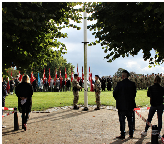
Flagdag i Aarhus

På Veteranhjem Midtjylland i Brabrand foregår der løbende aktiviteter for veteraner og deres pårørende f.eks. i form af fællesspisning, foredrag og fejring af højtider.