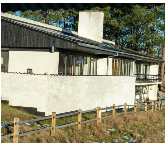
Veteranhjem Midtjylland i Brabrand

Hvert år afholder Aarhus Kommune i samarbejde med Veteranhjem Midtjylland en juletræsfest for byens veteraner og deres familier. Juletræsfesten handler om at skabe en god familieoplevelse, men indbyder også til netværk på tværs af veteraner og deres pårørende. Det er samtidig også en anledning for veteranfamilier at blive introduceret til Veteranhjem Midtjylland og veteranindsatsen i Aarhus Kommune.