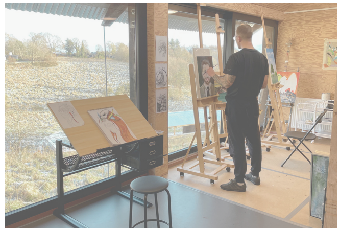
Malerhold i Udhuset på Veteranhjem Midtjylland.

Læs mere på Veteranhjem Midtjyllands hjemmeside: www.veteranhjem.dk/midtjylland