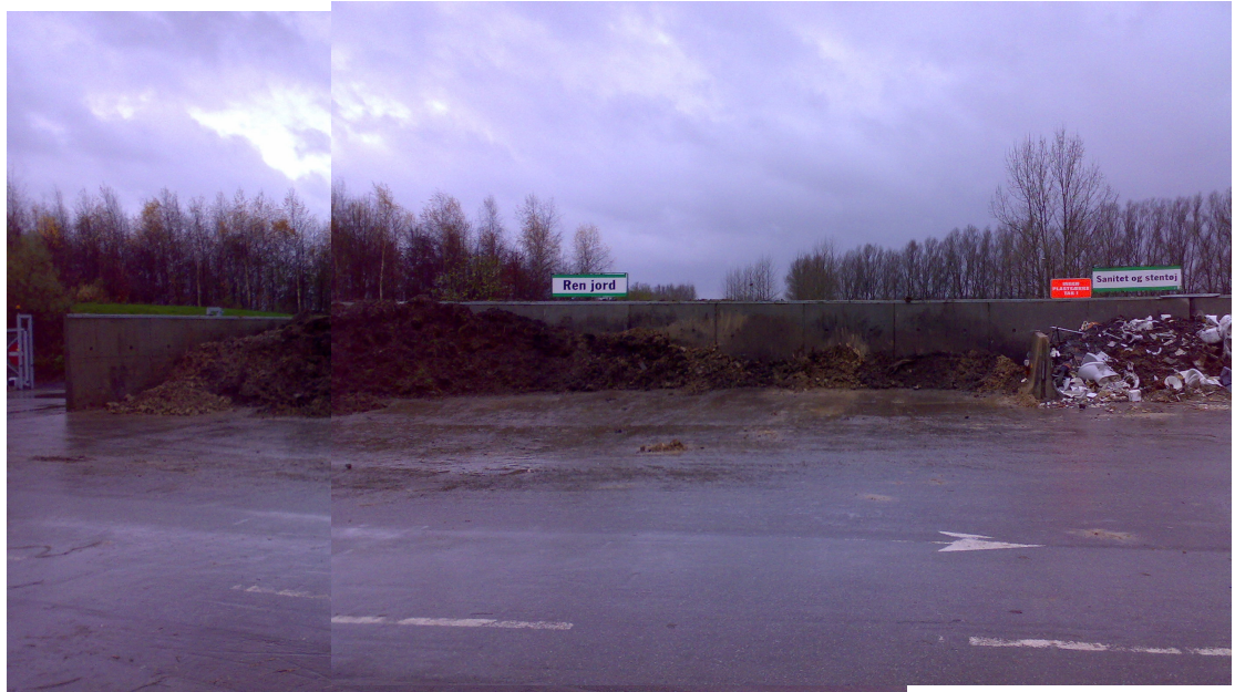
Billede nr. 1: Opbevaringspladsen på Lystrupvej er omkranset/afgrænset af betonstøttevægge på tre sider.