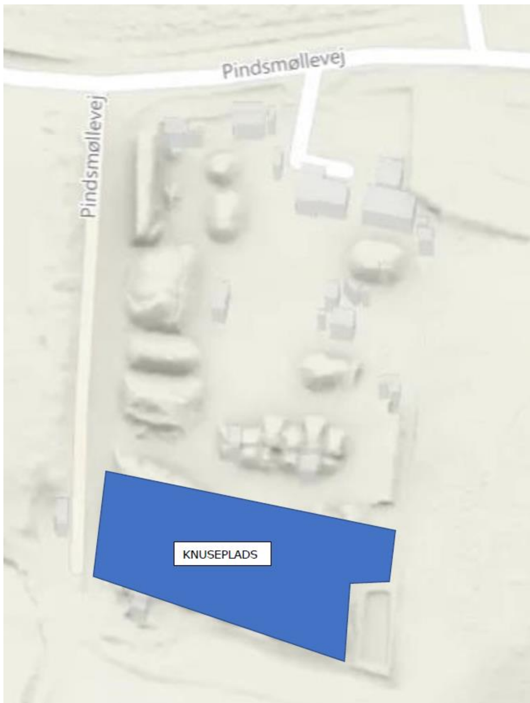
Billede 1: Placering af knusepladsen fra virksomhedens ansøgning. Aktiviteten med knusning og neddeling af affræset asfalt og restbeton fra betonvarefabrikker, foregår på den sydligste del af Pindsmøllevej 9, 8723 Hørning, markeret med blå.

Virksomhedens aktiviteter er omfattet af listepunkterne K 206 "Anlæg, der nyttiggør ikke-farligt affald" og listepunkt K 212 "Anlæg for midlertidig oplagring af ikke-farligt affald." Miljøstyrelsen har udarbejdet standardvilkår for ovenstående aktiviteter, som er indarbejdede i