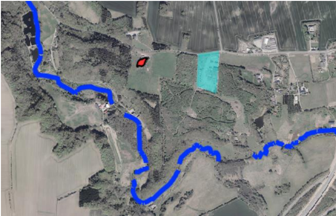
Billede 5. Oversigtskort over levesteder for stor vandsalamander er markeret med rødt og et potentielt levested for odder er markeret med blå. Det ønskede anlæg er markeret med turkis.

Aarhus Kommune har registreret Stor Vandsalamander i et vandhul på et areal, som er beliggende ca. 300 meter vest fra projektområdet. Herudover løber Aarhus å ca. 350 meter syd for matriklen. Aarhus å er et potentielt levested for odder, se nedenstående billede 4.