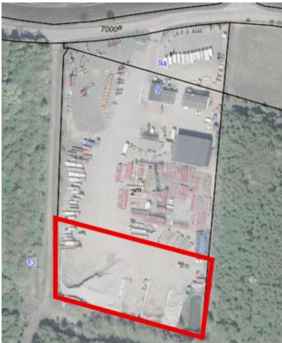
Billede 2: Placering af nedknusnings- og oplagringsaktiviteter på den sydlige del af Pindsmøllevej 9.

De ansøgte aktiviteter skal foregå på den sydlige del af matriklen. Se placering af anlægget med rød markering, på nedenstående billede 2.