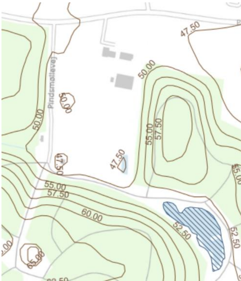
Billede 4. Oversigtskort over højdekurver på arealet.

På baggrund af afstanden og terrænforskellen vurderes aktiviteten ikke at kunne påvirke det nærliggende vandhul.