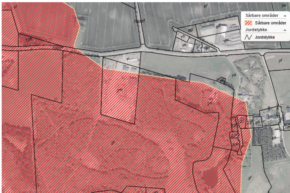
Billede 2: Matrikel nr. 2m, midtfor i billedet, hvor knuseaktiviteterne finder sted, er placeret i sårbart indvindingsområde.

OSD-områder er særligt sårbare over for forurening og er områder, hvor der sker stor grundvandsdannelse. OSD-områderne er udpeget så de kan dække det nuværende og fremtidige behov for rent drikkevand. Her skal der tages hensyn til grundvandets naturlige beskyttelse, kvantitet og bæredygtig indvinding.