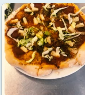
Efter, vi sætte pizza i ovn. Efter, vi spis pizza.