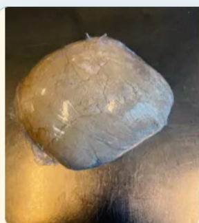
Dej Jeg laver en godt dej

Næste dag bad vi eleverne lave en billedbeskrivelse af alle etaper af deres arbejde med at lave pizza. Vi instruerede dem mundtligt i at tage et billede for hver del af processen og gav eksempler på, hvad de dele kunne svare til i en opskrift, hvor fremgangsmåden er delt i trin. Vi opfordrede dem til at bruge tidsudtryk som først , bagefter og til sidst . Denne stilladsring afspejlede sig tydeligt i elevernes padlet-tekster, som nu havde mere til fælles med opskrift-genren end de første padlet-tekster.