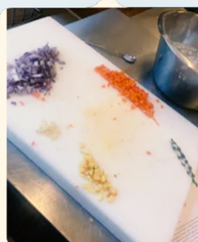
Først, jeg skiver ingrediens.