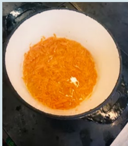
Hej I dag har jeg lært at lave mad Kabuli pulao jeg nød

som en faglig og professionel proces, som man kan uddanne sig indenfor. Men vi oplevede også, at der var langt fra omdeling af en printet dansk opskrift, som de ser ud i de fleste skolekøkkener og erhvervsuddannelser, til faglig og sproglig forståelse. Madopskriften kan for denne elevgruppe være en lumsk genre, som vi forestiller os, at alle kender til fra hverdagslivet, men som kan være udfordrende, når man er ny på dansk og i et dansk uddannelsessystem. Det kræver således en grundig stilladsering at åbne teksten for eleverne og gøre dem til aktive brugere af madlavningssproget – en pointe, som ikke alene gælder for madlavning på Aarhus Tech, men for instruerende faglige tekster i en række forskellige sammenhænge.