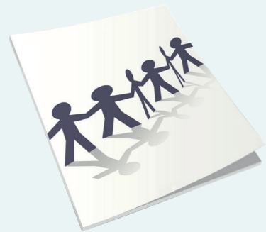
Strategi for attraktive og bæredygtige arbejdspladser