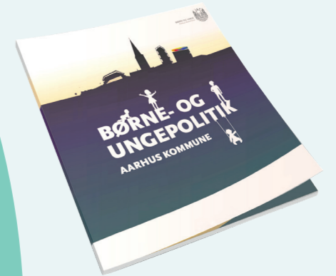
Børne- og ungepolitikken