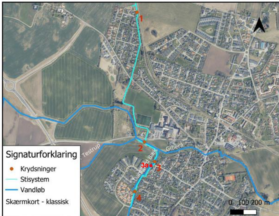
Figur 1. Kort fra ansøgningen, der viser hvor stisystemet (lyseblå) krydser de tre vandløb. Krydsningerne er angivet med røde punkter, vandløb er angivet med mørkeblå. Det lille vandløb mod nord er ikke målsat i vandområdeplanerne 2021-2027 og fremgår derfor ikke af kortet. Denne afgørelse vedrører krydsning 3 (permanent krydsning ved Agervej), Krydsning 3a (midlertidig krydsning ved Agervej) og 4 (permanent krydsning ved Ovesdal).

Krydsningerne etableres som broer hen over vandløbet. Broernes materialer vil bestå af enten træ eller glasfiber, og de etableres med punktfundamenter, der placeres uden for vandløbets kronekant.