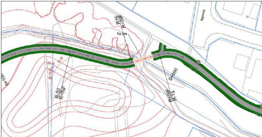
Figur 2. Kort fra ansøgningen over krydsningen ved Agervej.