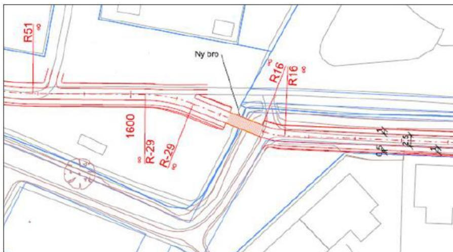
Figur 3. Kort fra ansøgningen over krydsningen ved Ovesdal.

Ansøger har været i dialog med Vandløbsmyndigheden, idet der er planlagt et vandløbsrestaureringsprojekt af Damgård Bæk ved krydsningen ved Agervej. Der indsættes derfor vilkår i nærværende tilladelse, om at krydsningen skal tilpasses det ændrede forløb af vandløbet (figur 4).