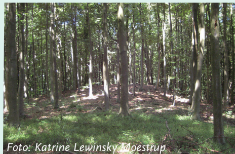
En gravhøj gemt i skoven nær skovfogedhuset Emmalyst. Set fra syd.

De ældste gravhøje kaldes stendysser og stammer fra den yngre stenalder. Dysserne er runde eller aflange og har et eller to stenkamre. De blev oprindeligt bygget til én person, men med tiden er flere personer gravlagt her.