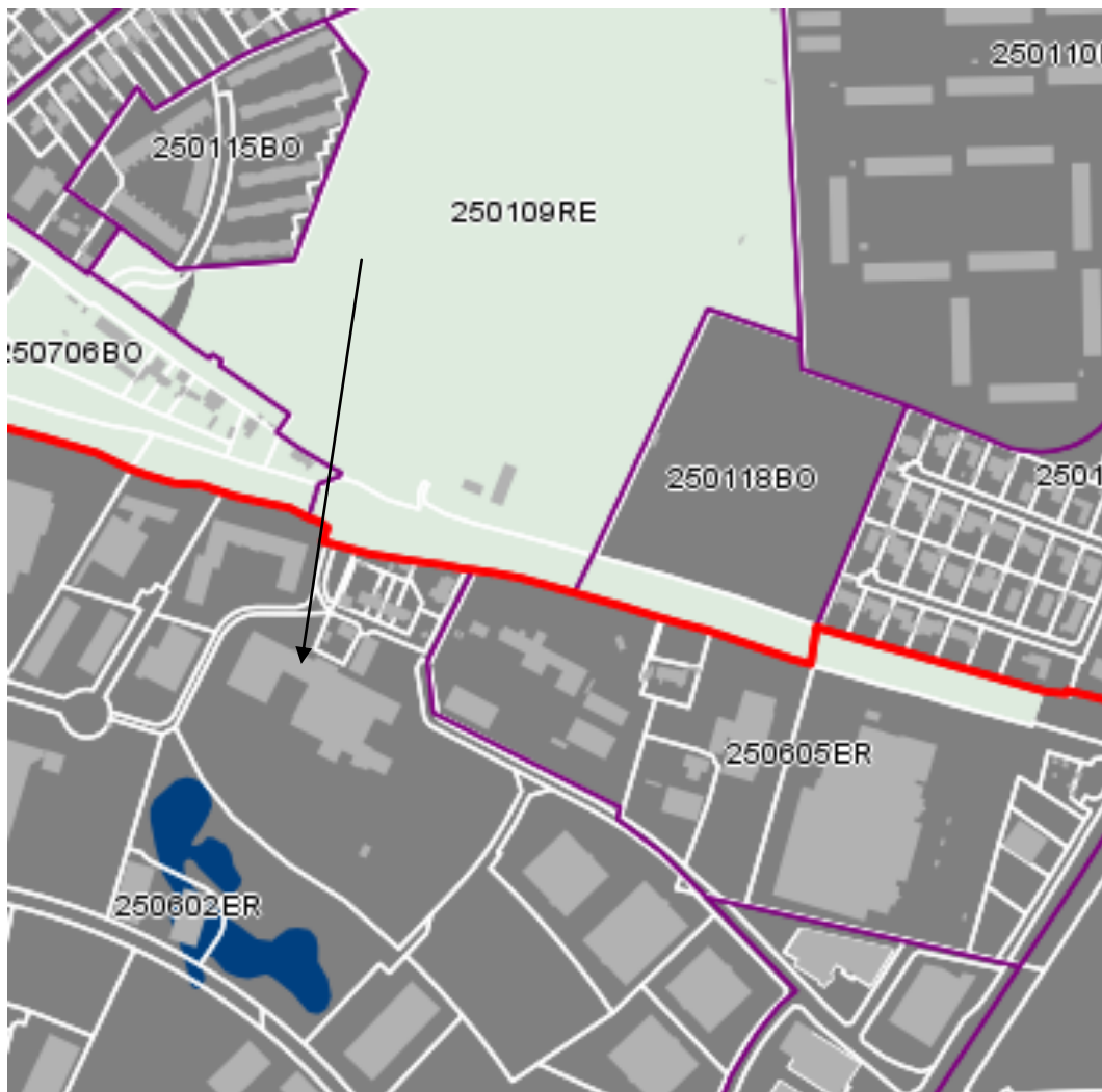
Rammeområde 259602ER, jf. Kommuneplan 2013.

Nærmeste boliger er beliggende umiddelbart nord for virksomheden indenfor erhvervsområdet. Nærmeste egentlige boligområder er beliggende nord for Viborgvej i en afstand af ca. 150 meter fra virksomheden.