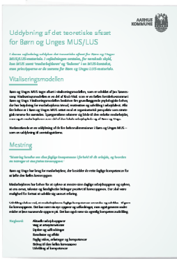
Uddybning af det teoretiske afsæt for Børn og Unges MUS og LUS