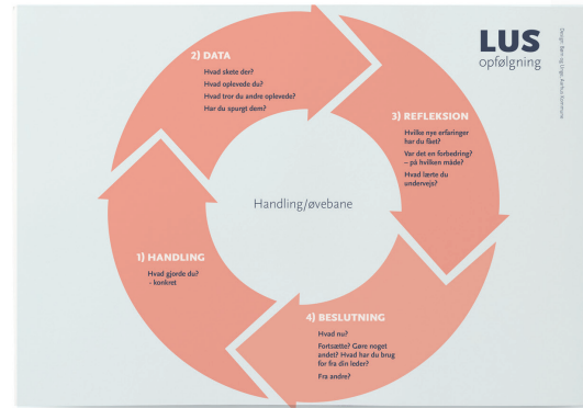
Samtaleguide til løbende opfølgning på aftalte handlinger i LUS'en