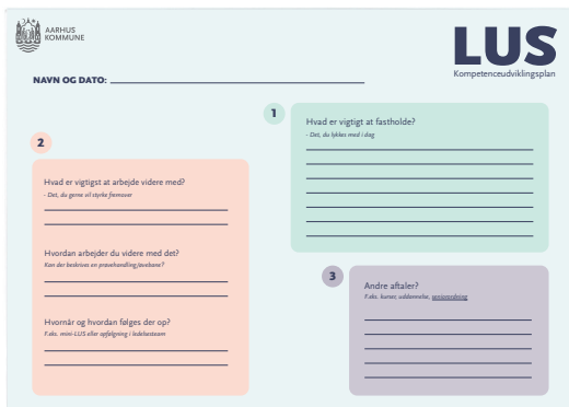
Kompetenceudviklingsark - til opsummering af aftaler og handlinger på baggrund af LUS'en, som også udgør referat af samtalen