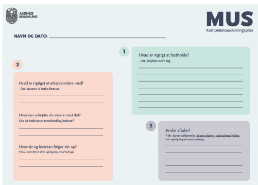
Kompetenceudviklingsplan - til opsummering af aftaler og handlinger på baggrund af MUS'en, som også udgør referat af samtalen