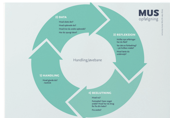
Samtaleguide til løbende opfølgning på aftalte handlinger i MUS'en