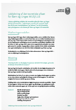
Uddybning af det teoretiske afsæt for Børn og Unges MUS og LUS