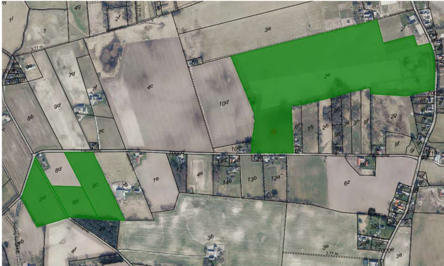
Billede 1. Ejendommen består af de 4 markerede matrikler, der er samnoteret som én landbrugsejendom uden beboelsesbygning.

Der er ansøgt om placering af et nyt bygnings sæt syd for Fløjstrupvej på matrikel nr. 9c Neder-Fløjstrup By, Malling.