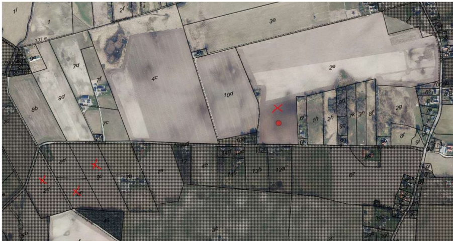
Billede 2. Den sorte skravering markerer det sårbare område

Som udgangspunkt tilstræbes ikke byggeri i de sårbare områder af hensyn til grundvandsbeskyttelsen, dels fordi den øgede aktivitet på overfladen i disse områder øger risikoen for, at forurenende stoffer trænger ned i grundvandsmagasinerne, som vandværkerne henter drikkevand fra, dels fordi bebyggelsen reducerer grundvandsdannelsen til magasinerne.