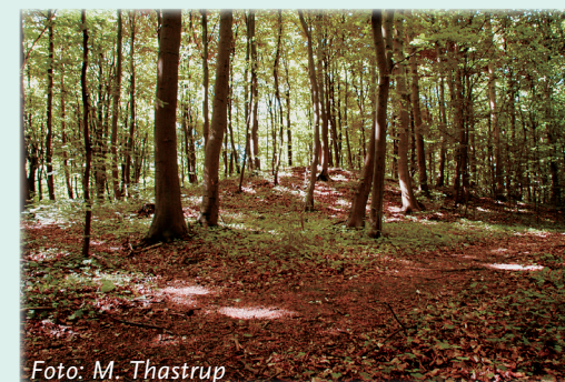
Langhøjen Ulvehovedet gemt i bøgeskoven. Set fra nord

Hulvejene begynder ved den gamle Varna mølle, som lå ved Skambækkens udløb. Møllen blev bygget i 1592 og var i brug indtil 1890'erne. Det var en stampemølle, der blev brugt til forarbejdelse af skind. Man kan nemt forestille sig vogne fyldt med skind køre ned af bakken.