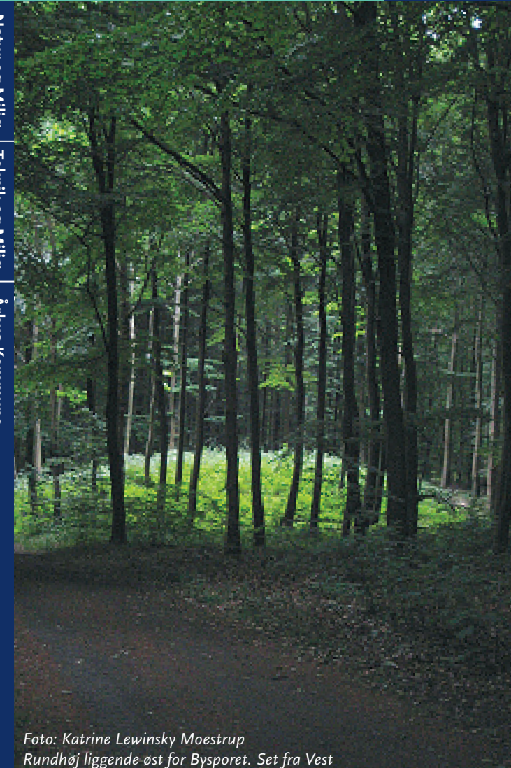
Rundhøj liggende øst for Bysporet. Set fra Vest