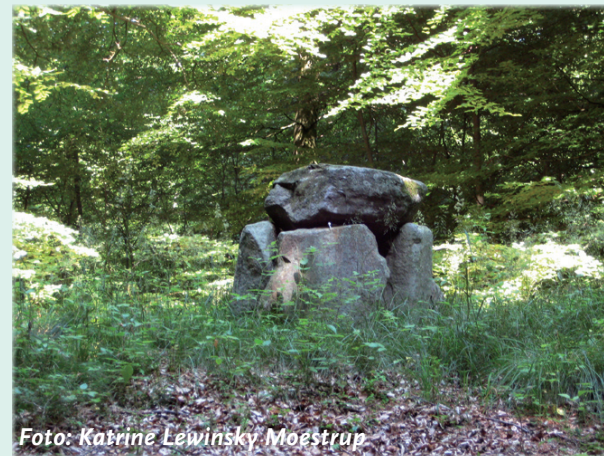
Det falske dyssekammer. Set fra syd.

For ca. 200 år siden byggede herskabet på Moesgård et stenkammer på denne bronzealderhøj. På det tidspunkt dyrkede man oldtidens storhed. Gravhøjen med stenkammeret indgik i Moesgårds daværende imponerende haveanlæg, hvor en menneskeskabt lysning i skoven gik fra haven ned til Nordre Strandmark.