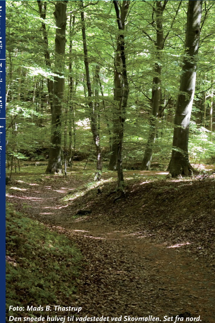
Den snoede hulvej til vadestedet ved Skovmøllen. Set fra nord.